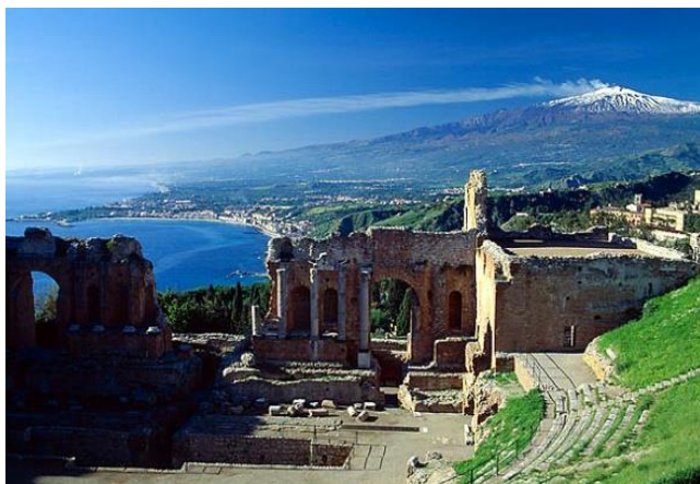
Konferencijos vieta – Taormina, Sicilija

Keletas vaizdų iš EAGT – AAGT konferencijos Sicilijoje: